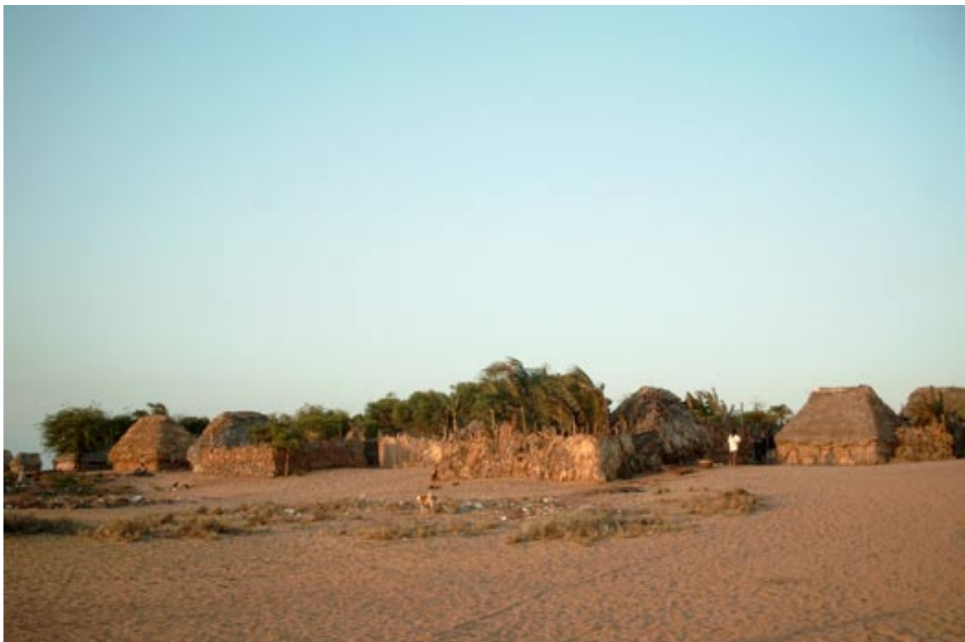
Het kleine vissersdorpje